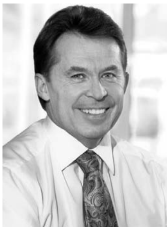
Сергей Богданчиков ПРЕЗИДЕНТ ОАО «НК «РОСНЕФТЬ»

— Сергей Михайлович, главный вопрос, который в первую очередь волнует всех акционеров нашей компании — низкая стоимость ее акций. Почему цены на бумаги «Роснефти» так упали, и чего ждать их владельцам в дальнейшем?