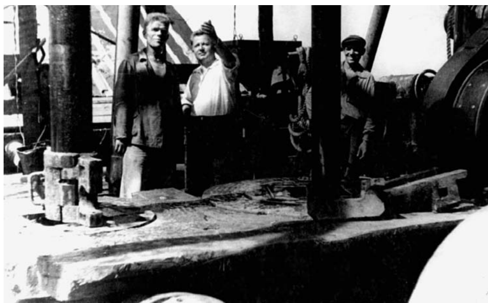
Первая двустовальная скважина в Дагестане