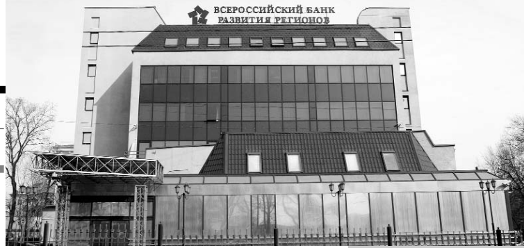
Всероссийский банк развития регионов (ВБРР)

создан в соответствии с Постановлением Правительства Российской Федерации №905 от 7 сен-