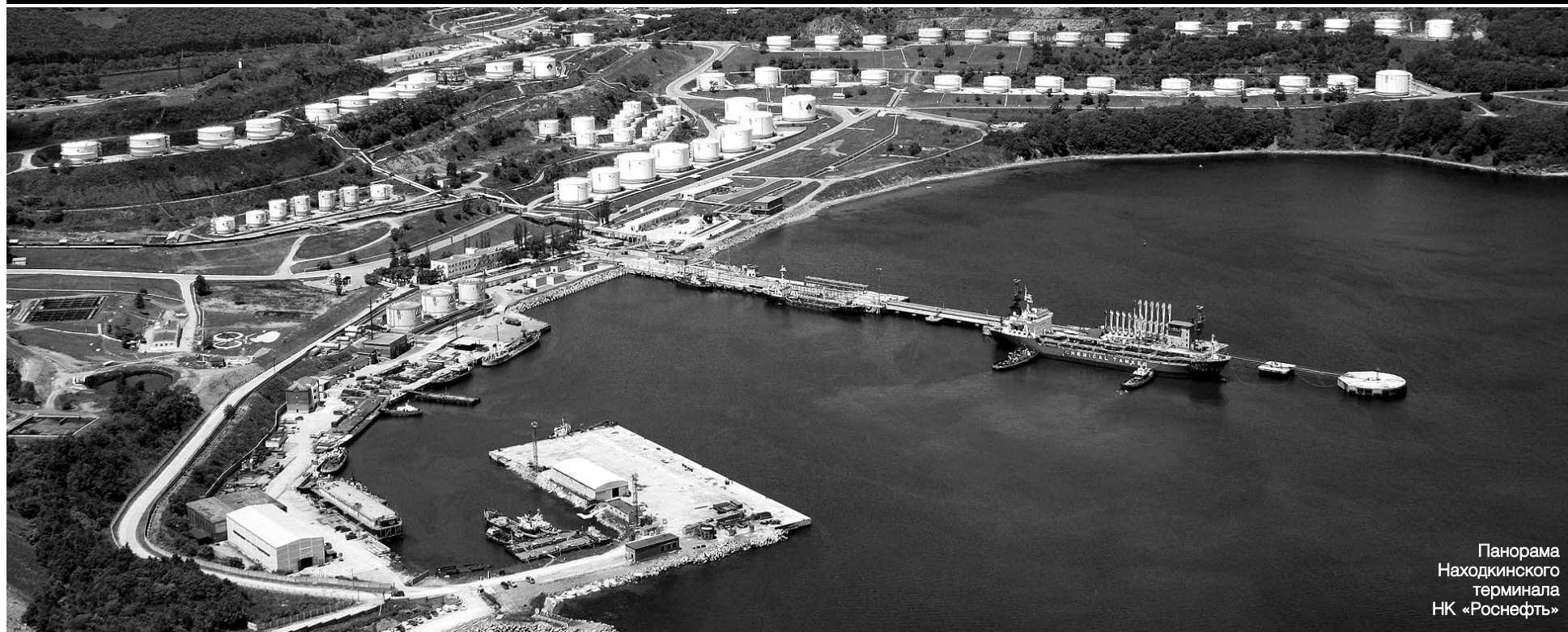
Панорама Находкинского терминала НК «Роснефть»